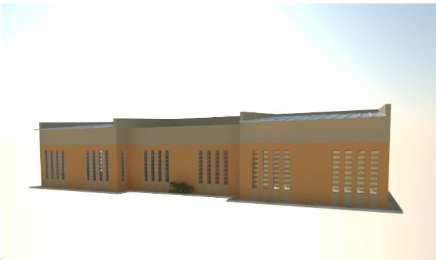
Imagem da maquete eletrônica – Perspectivas.